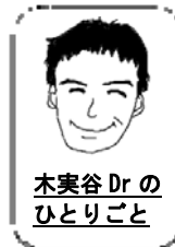
木実谷 Dr の ひとりごと

災害時、ライフラインが途絶えたり、避難所生活になった場合、お子さんが元気かどうか見るときに「食べる」「寝る」「遊ぶ」「排泄する」が、できているかが大事になります。「食べる」は、以前も紹介したミルクなどの備えや、レトルトの離乳食、子ども用のおやつほかに、脱水予防に経口補水液などを準備しておくといいでしょう。また、スプーンは使い捨ての物が便利ですが、常に使用している好きなキャラクターなどのスプーンだと安心でき、再利用もできる利点もあります。「寝る」については、なれない生活で、大人も子どもも睡眠不足・生活リズムの変化に混乱し、安らぎがえられにくくなります。お子さんが気にしているぬいぐるみや、タオルなど、安心感が得られるものを準備しておくといいですね。(11月号につづく)