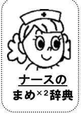
ナースの まめ×2辞典

手足口病の流行は落ち着きつつあります。RS ウイルス感染症や同じく乳児に喘鳴(ぜーぜー)を引き起こすヒトメタニューモウイルス感染症も見られるようになってきました。どちらも、乳児期早期に感染すると咳鼻水が多くなり、呼吸が荒く、哺乳が低下したりします。症状がみられつらそうな場合は受診をお勧めします。