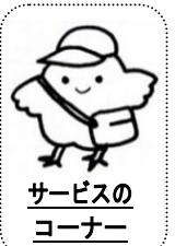
サービスの コーナー