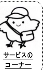
サービスの コーナー