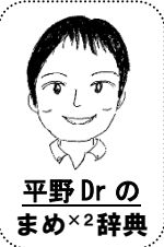
平野 Dr. の まめ×2辞典

手足口病が流行しています。 手足口病は口の中、手、足、おしりなどを中心に水疱性の発疹が見られる病気です。一般的には軽症で、特別な治療は必要としませんが、口の痛みや発熱で辛そうな時は解熱剤を使ってください。また口の痛みにより食事が取りにくくなるため、柔らかめの食事を心がけてください。