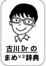
古川 Dr の まめ×2辞典

先月に引き続き胃腸炎の流行が保育園等でみられています。また、おたふく(流行性耳下腺炎)が散見されます。おたふくは難聴、精巣炎、無菌性髄膜炎などを合併することがありますが、重篤な合併症はワクチンで予防することができます。1歳と就学前の2回接種をお勧めしています(いずれも自費)。接種を希望される方はクリニックまでご相談ください。