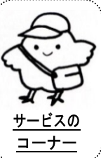
サービスの コーナー

約 3 年ぶりにこのコーナーを担当します。今回は、おねしょ(夜尿)についてお話しします。相談を控えていたりする方も多いのではないのでしょうか。実際、日本の夜尿症患者さん 80 万人のうち、8 万人程度しか治療を行っていません。放っておくと 1 年後に治っている子は 15% 程度です。外来に定期通院していただければ、1 年後には約 50% が治っています。さらに、コロナ禍当初の厳格なステイホームで子供たちが手持無沙汰だった時期に夜尿症治療に集中して取り組んでみていただいたところ、半年後には約 70% の方が治癒されていました。子供自身や保護者が夜尿を全然気にしていなければよいですが、こっそり傷ついている子も多く、なかには他の病気が隠れていることもあります。目安としては小 1 になっても夜尿があるようでしたら、ぜひ一度ご相談いただけたらと思います。