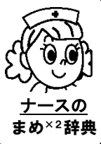
ナーズの まめ×2辞典

新型コロナウイルスのニュースばかりですが、胃腸炎の流行も続いています。ノロウイルス・ロタウイルスをはじめ、胃腸炎をひき起こすウイルスはアルコールでは消毒できないものもあります。下痢嘔吐処理後の流水・石鹸による手洗いは確実にいきましょう。下痢嘔吐が続き元気がなくなってきた場合は医療機関を必ず受診しましょう。