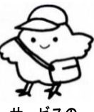
サービスの コーナー