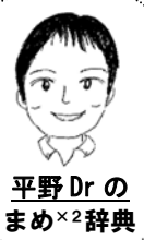
平野 Dr の まめ×2 辞典

先月同様に胃腸炎のお子さんが目立ちます。家庭内で感染を広げないために嘔吐物や便を処理したあとはしっかり手洗いをしましょう。また吐物や便で汚れてしまった場所を、次亜塩素酸ナトリウムなどの塩素系消毒剤や薄めた家庭用塩素系漂白剤で拭き取り、その後は水拭きしましょう。