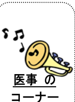
医事 の コーナー