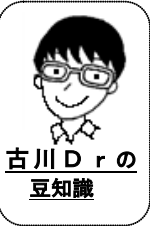
古川 Dr の豆知識

8月中は徐々にRSV感染のお子さんが増えてきています。以前は冬に流行するウイルスでしたが、近年は一年中見られるようになりました。喘息のようなゼーゼーを引き起こす風邪のウイルスで、月齢の小さいお子さんが感染すると症状が重くなる場合があります。接触感染でもうつりますので、しっかり手洗いうがいをして予防しましょう。