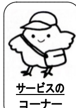
サービスの コーナー