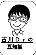
古川 Dr の豆知識

夏に多い、とびひ(伝染性膿痂疹)が増えました。あせもや湿疹に菌が入りびらんの周りに水ぶくれができ膿がたまる皮膚の感染症です。掻き壊した手で他の場所を掻いてどんどん広がり、火事の飛び火のようであつという間に広がることからとびひと名付けられています。抗生剤の軟膏や内服で治療します。集団生活は必ずしも休まなくてよいですが、プールはとびひが乾いて固まるまでは休みましょう。