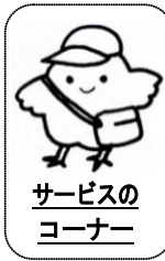
サービスのコーナー

「だって私は98歳だもの」というおばあちゃんに、猫が誕生日のお祝いをしました。用意したケーキのロウソクは5本で、次の日から、おばあちゃんは5歳だもの!とそれまで断っていた魚釣りをしたり、川を飛び越えてみたりと色々な事に挑戦します。おばあちゃんと猫のやりとりで心に温まる絵本です。