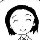
横山 Dr. のひとりごと

いま何時かな?お父さんやお母さんのしている腕時計ってカッコイイね。難しいけど作ってみよう!出来たら、自分の好きな時間を描いてみてね。明日晴れますように・・・てるてるぼうずは上手に折れたかな?