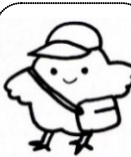
サービスのコーナー

まずはバイ菌を石けんでよく洗い流すことです。さらに症状の程度によって抗菌薬の軟こうや飲み薬の抗生剤を使用します。とびひの数が増えているときは治療を変更することがあります。とびひかな?と思ったらご相談ください。