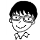
古川 Dr の豆知識

今月もウイルス性の胃腸炎が流行していました。学校、幼稚園などが始まり、溶連菌感染症も増えてきています。